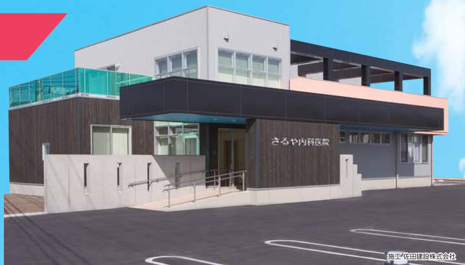
施工/佐田建設株式会社